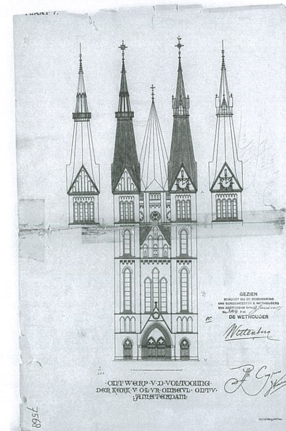
Ontwerptekening Posthoornkerk door P.J.H. Cuypers, 1887, Stadsarchief Amsterdam.