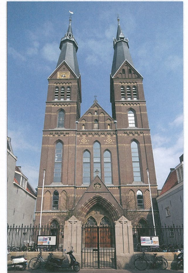
Posthoornkerk na restauratie met nieuw voorplein, 2012, foto Ernest Annyas.

“Een interessant project”, vertelt Van Iterson, “omdat je je moet bewegen in een kleine ruimte. De kerk mag