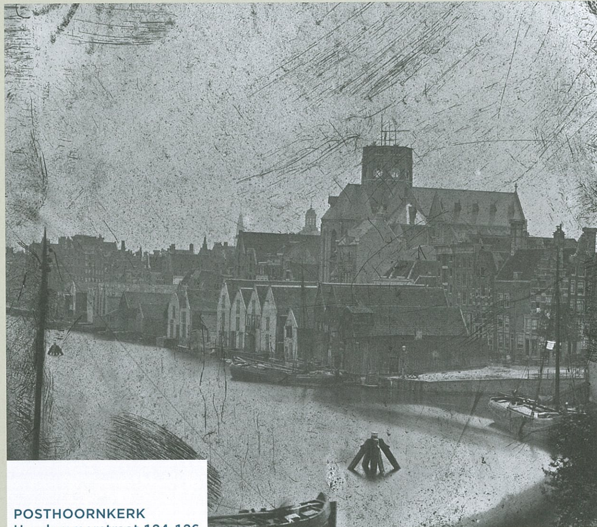
POSTHOORNKERK Haarlemmerstraat 124-126 in Amsterdam

Westerdok, gezien vanaf scheepswerf De Zwaan op het Bickersplein, richting de Haarlemmer Houttuinen. Op de achtergrond de Posthoornkerk in aanbouw met links daarvan de lantaarn van de Ronde Lutherse Kerk, 1862, foto Jacob Olie, Stadsarchief Amsterdam.